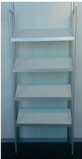
ESTANTERIA INCLINADA O RECTA CON 4 ESTANTES