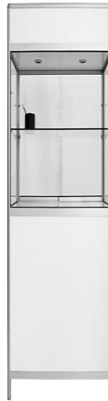
VITRINA DE CRISTAL Y MADERA CON PUERTAS Y LUZ 200X50X45