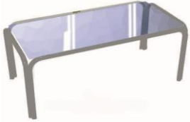
MESA DE CENTRO 100X50X50