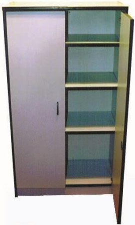
LIBRERÍA CON PUERTAS Y ESTANTES DE 140 - 75 CM DE ALTA