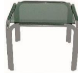
MESA RINCONERA 50X50X50